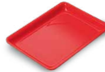
Vassoio in acrilico In acrilico, specifico per alimenti